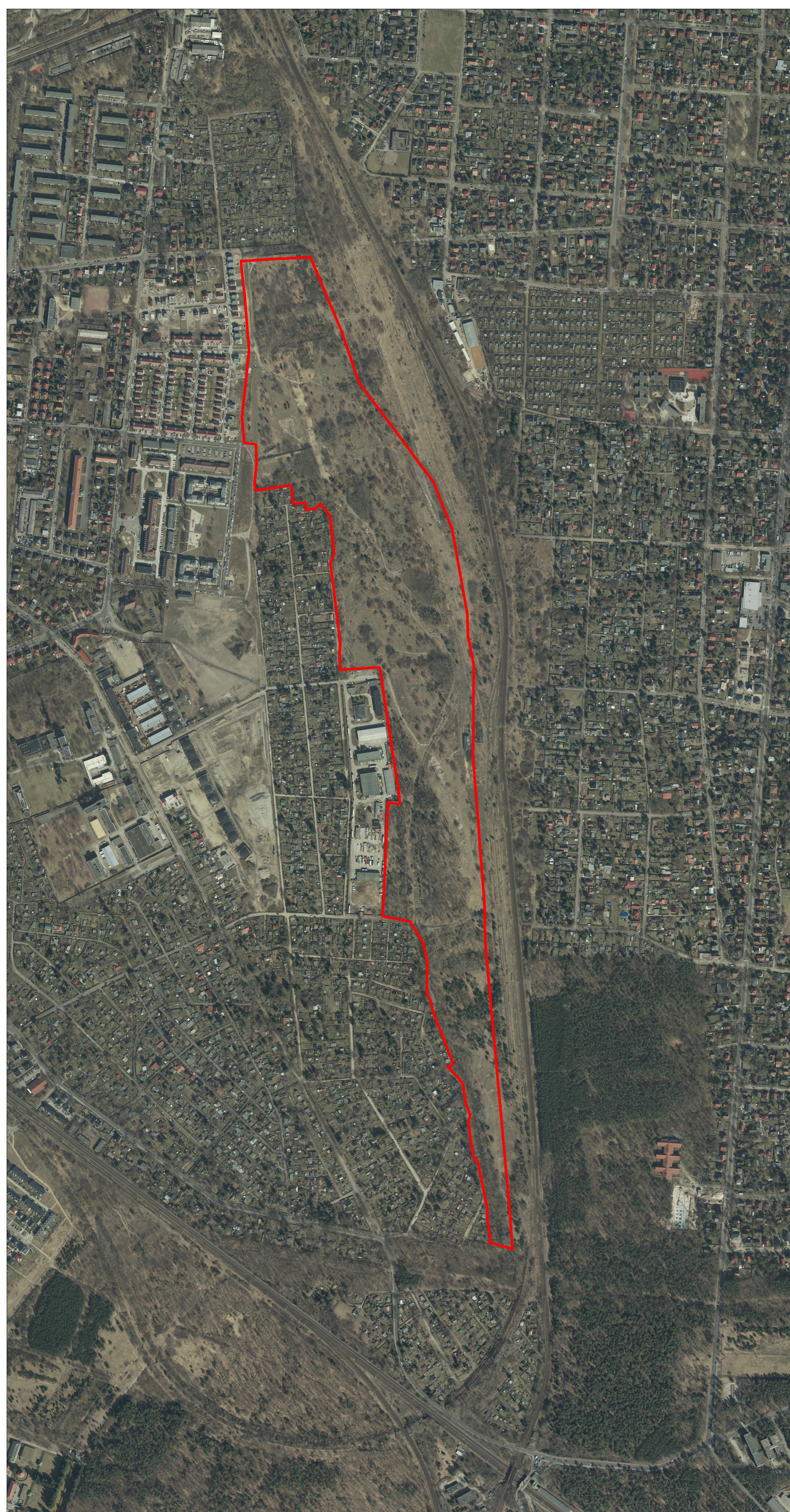
Ausschnitt aus der Luftbildkarte Stand 2019